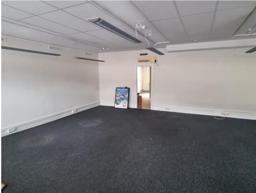
Så här ser den nya lokalen ut för närvarande